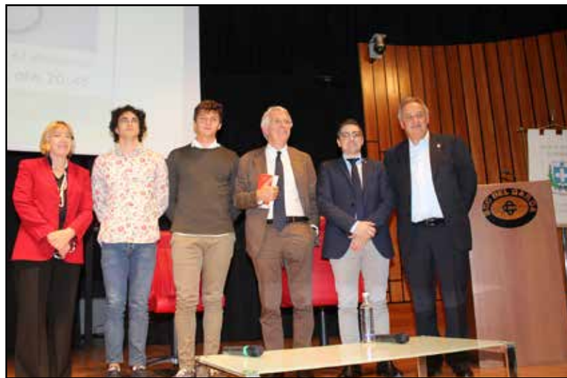
I protagonisti della piacevole serata.