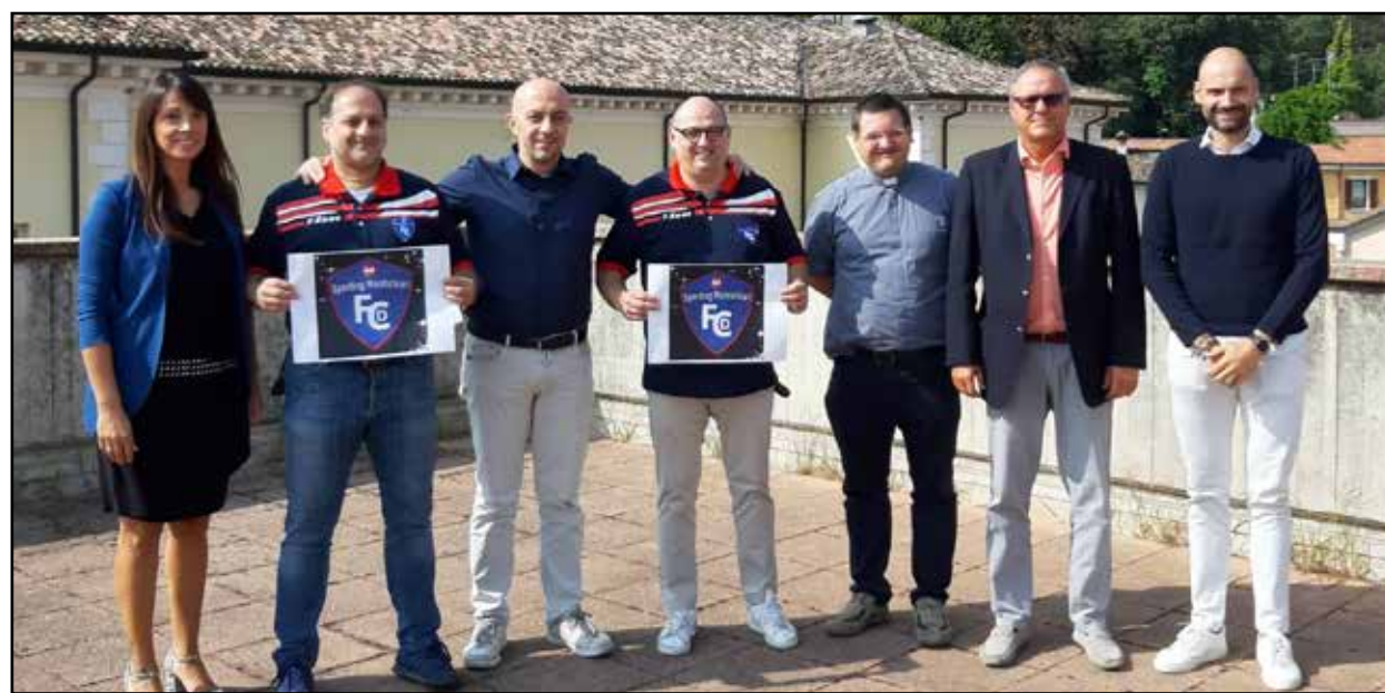
La presentazione dello Sporting Montichiari FcD all'Amministrazione comunale.

Per don Toti "dare spazio ad una società sportiva significa adempiere alla filosofia di San Giovanni Bosco a cui l'oratorio è dedicato, per il quale amare i giovani significava seguire ciò che essi amano". La segreteria dello Sporting Montichiari FcD risponde al numero 371/4295210.