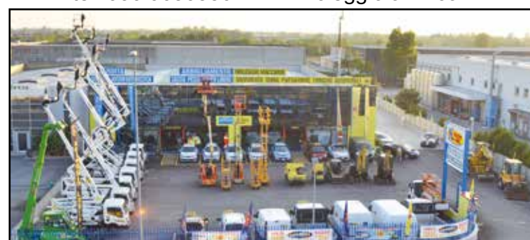
La nuova sede della Noleggio Lorini in zona industriale, via E. Montale 15.

SEDE: MONTICHIARI (BS) - Via E. Montale, 15 FILIALI: CALCINATO - CASTEGNATO tel. 030.9650556 - www.noleggiolorini.com