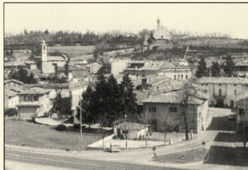
Borgosotto, borgata di gente semplice e genuina, dalla vita dura, soprattutto per i molti emigranti.

Sofferta, ma l'unica! Noi non ci siamo mai considerati Svizzeri, la cui patria ringrazio comunque per l'ospitalità concessa. Si era ristrutturata una casa, riducendo di molto i nostri risparmi e avevamo dato una posizione ai figli: era opportuno rimanere a Zurigo a tra-