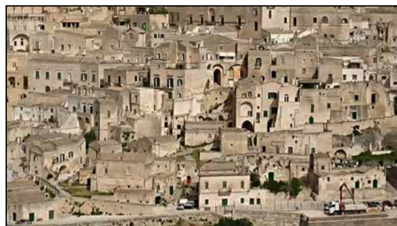
Matera: Capitale europea della Cultura 2019.

Sempre candidi, ma con le cupole di pietra grigia, ci vengono incontro i trulli di Alberobello, che raggiungiamo attra-